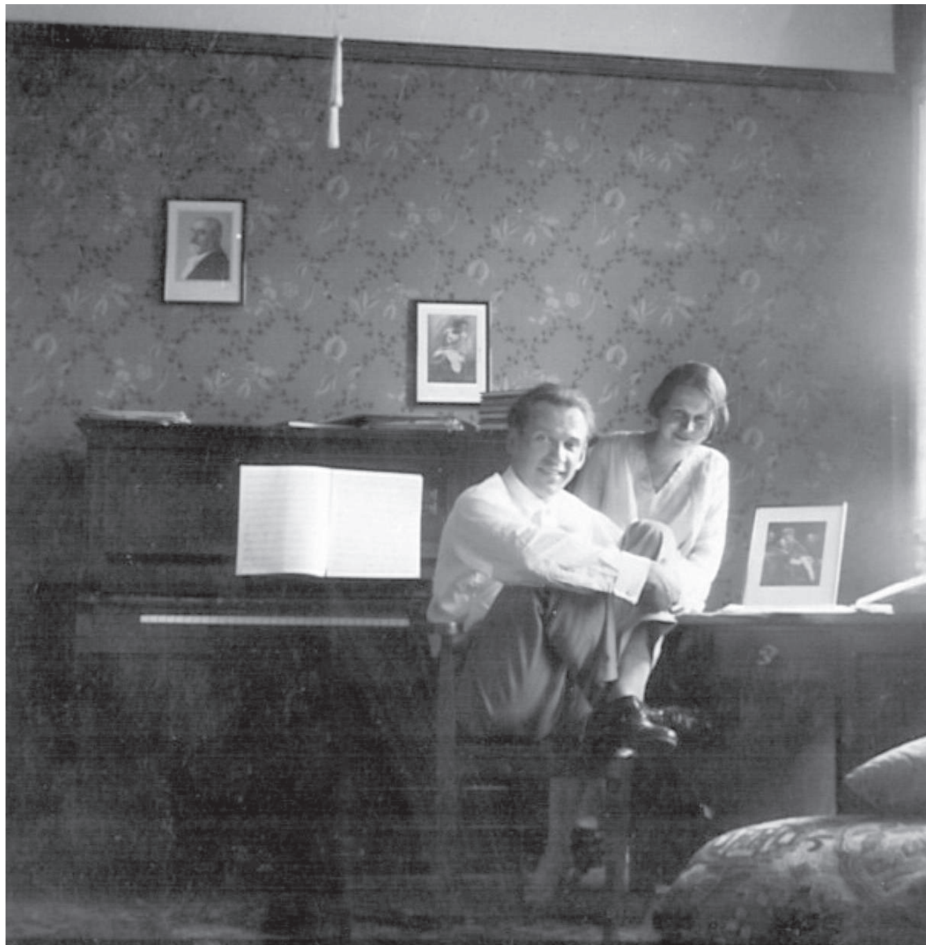
Lūcija Garūta ar draugu, dziedātāju Marisu Vētru (1901-1965) (20. gs. 20. gadi)